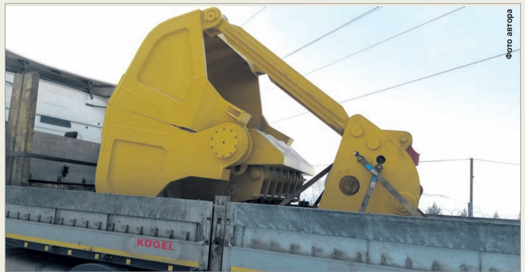
Новый грейферный ковш для мостового крана

конусной дробилки среднего дробления, установленной на корпусе 3-4. Это важная составляющая, которая позволит обеспечить выполнение объёмов переработки руды.