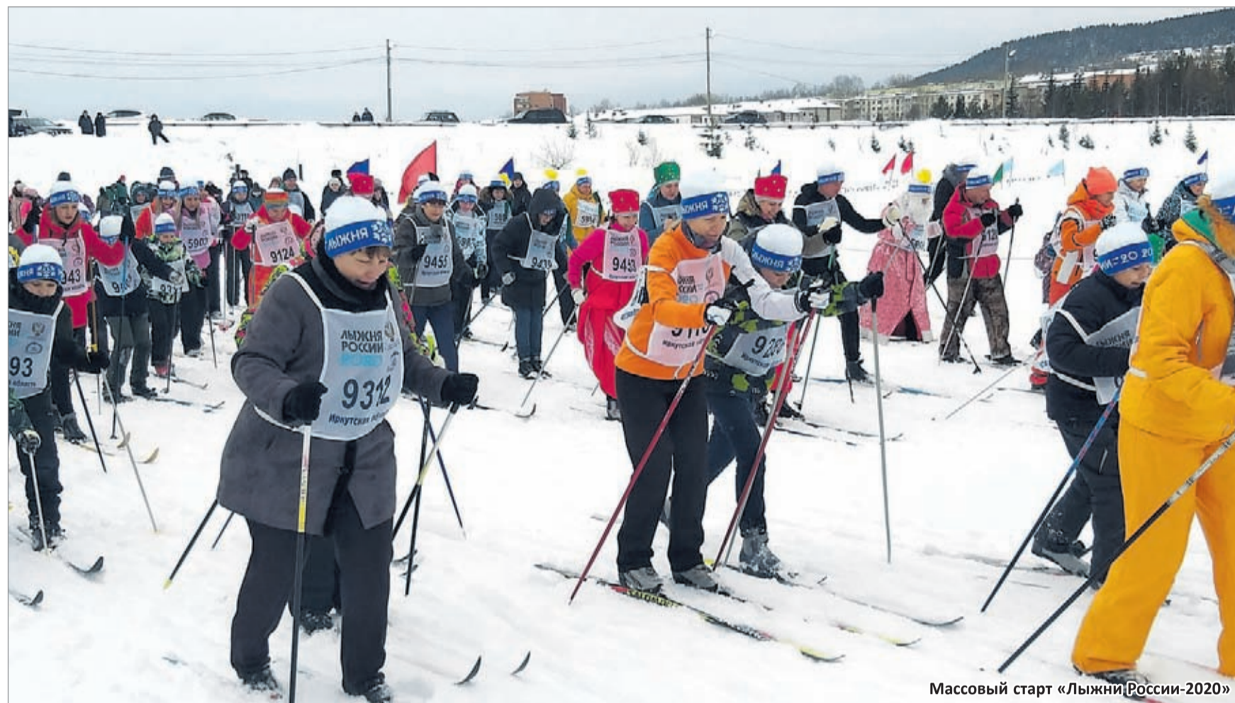
Массовый старт «Лыжня России-2020»

С 1 по 22 февраля 1968 года «великолепная шестёрка» лыжников КГОКа по бездорожью, в сильные морозы, по рекам Лена и Витим прошла 1 240 километров за 20 ходовых дней, в среднем — по 60